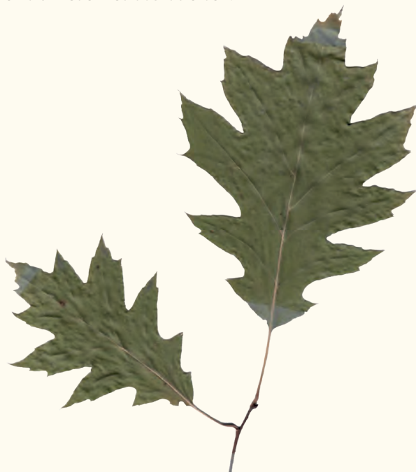
Quercus rubra Rot-Eiche Fam. Fagaceae 4kt. Homomelis ähnliche Fundort: Zittauer Gebirge Revier Oybin Bürgerallee leg.: A. Siltmeier am 16.09.84 det.: A. Siltmeier am 16.09.84

Wer kann, bringt bitte selbst ein Pflanzgerät (Hacke, Spaten) mit. Wir treffen uns am Sonnabend, dem 29. März 2025 um 8 Uhr hinter dem Restaurant „Waldidyll“.