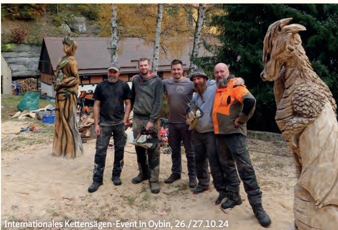
Internationales Kettensägen-Event in Oybin, 26./27.10.24

Unter den geförderten Vorhaben des letztjährigen Regionalbudgets befand sich auch eine besondere Veranstaltung im Kurort Oybin. Am 26. und 27. Oktober 2024 verwandelten sich auf der Naturbühne sechs heimische Eichenstämme in Märchenfiguren. Fünf internationale Carving-Künstler bearbeiteten mit ihren Kettensägen, Holzmeißeln und Schleifmaschinen unter den interessierten und gespannten Blicken der zahlreichen Zuschauer das harte Naturmaterial und brachten einzigartige und kunstvolle Holzskulpturen hervor – die Hexe Baba Jaga, einen Bär, den aus den Marvel-Comics bekannten Groot und andere Figuren ließen die Welt der historischen und zeitgenössischen Märchen und Mythen vor dem Auge des Betrachters