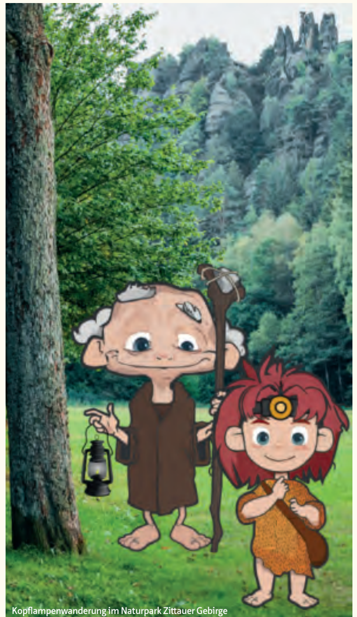
Kopflampenwanderung im Naturpark Zittauer Gebirge

Erleben Sie das Zittauer Gebirge von seiner schönsten Seite – bei einer Wanderung, die in Erinnerung bleibt!