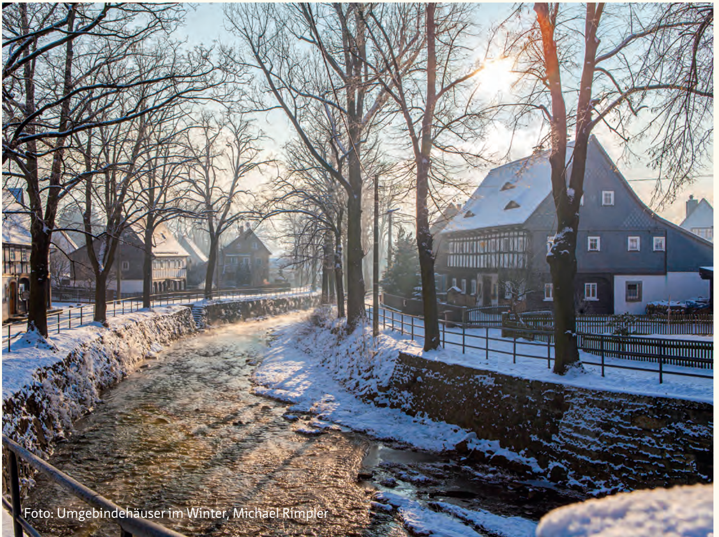
Foto: Umgebendehäuser im Winter

Sie sammeln Frühlingskräuter auf den Jonsdorfer Bergwiesen, bereiten eine kleine Wildkräuterspeise für den gemeinsamen Verzehr zu und erhalten Tipps zu den Frühjahreskräutern. Voranmeldung über das Kundenbüro der Schmalspurbahn ist erforderlich.