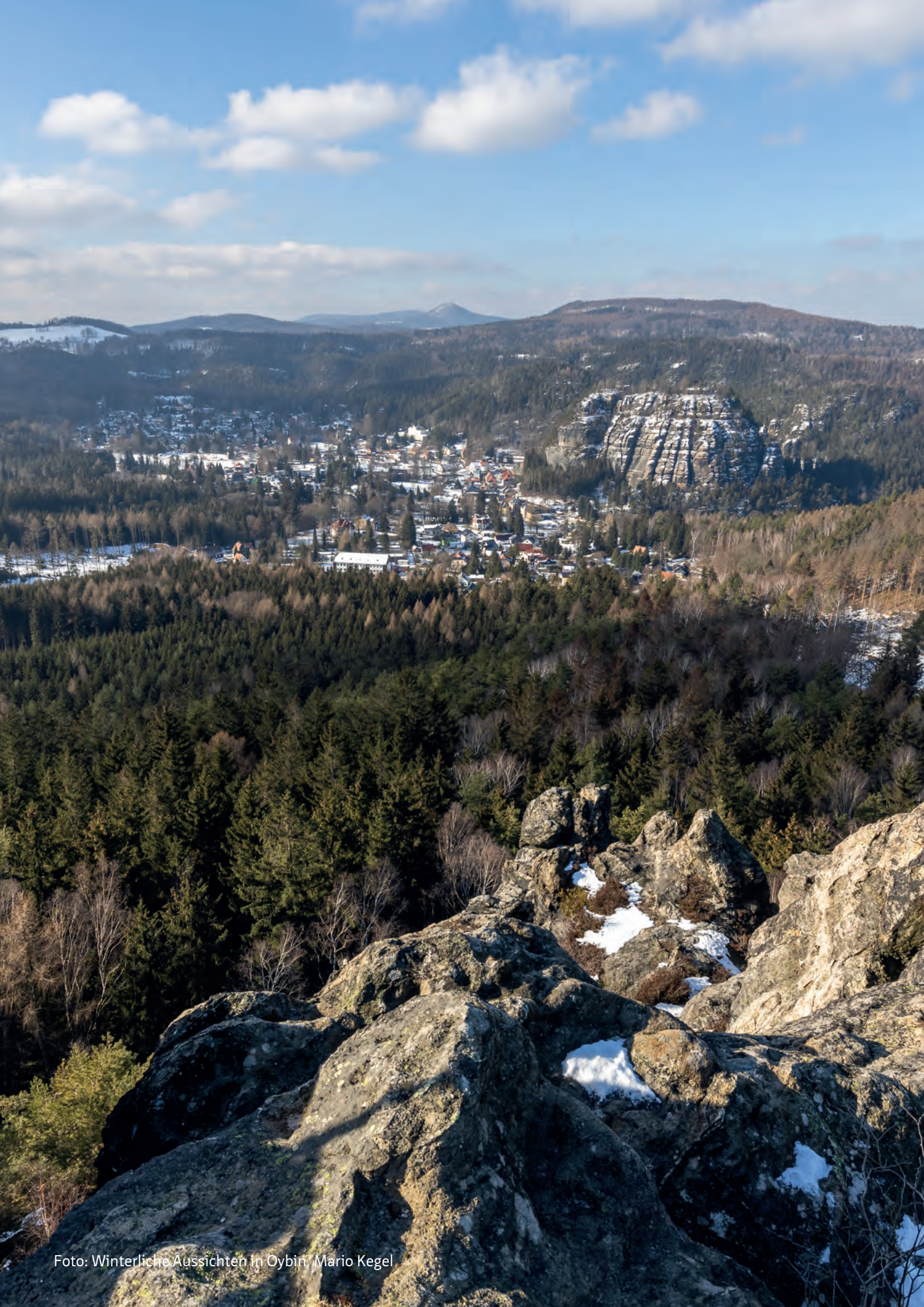
Winterliche Aussichten in Oybin