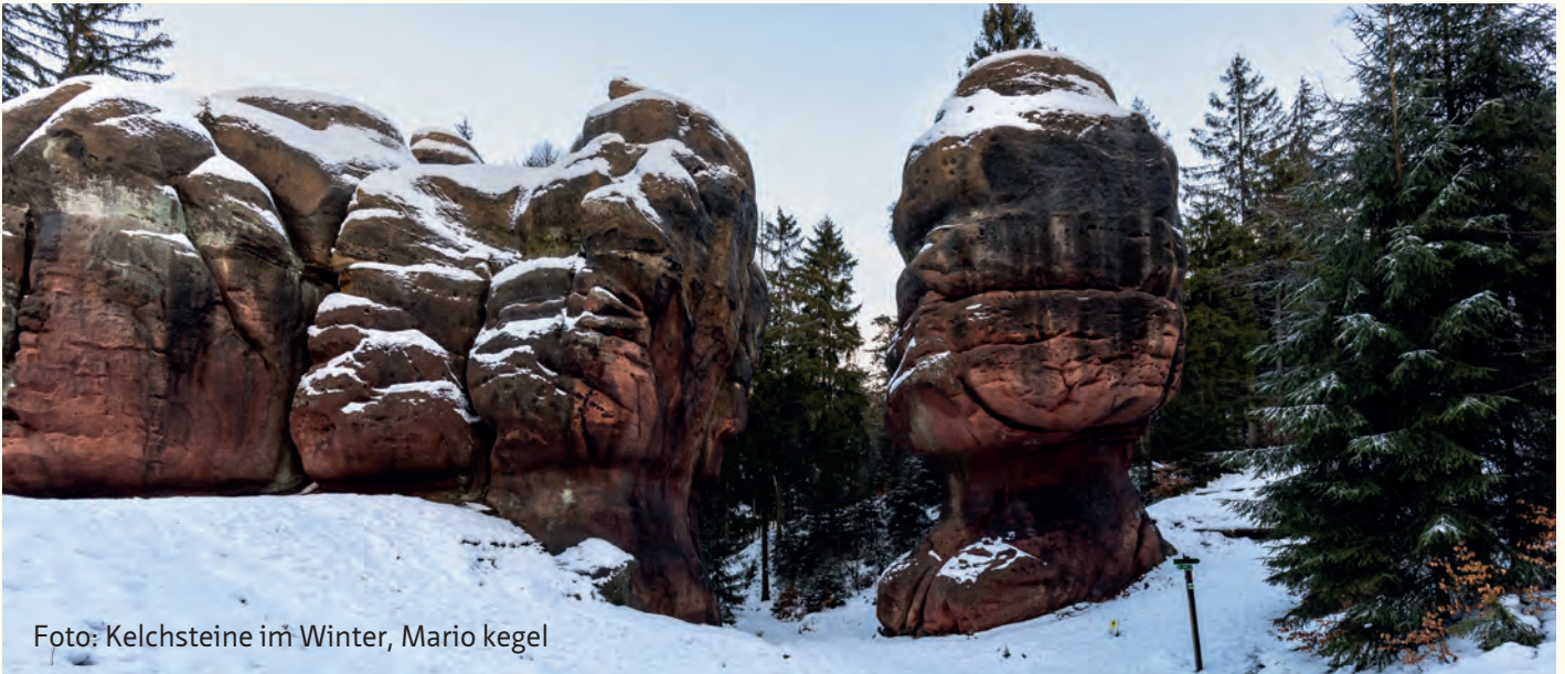
Kelchsteine im Winter