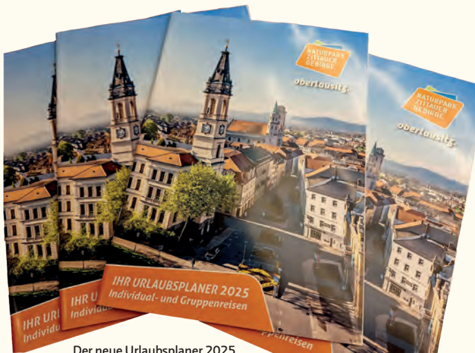
Der neue Urlaubsplaner 2025

Der Urlaubsplaner 2025 ist ab sofort erhältlich. Interessierte finden ihn bei den Tourist Informationen der Region oder online unter www.zittauer-gebirge.com/infomaterial . Dort steht er als Download bereit oder kann bequem nach Hause bestellt werden.