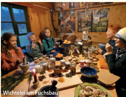
Wichtelei am Fuchsbau

Menschen, welchen der Erhalt der Natur und das Wohl unserer nachwachsenden Generation am Herzen liegt, können solche gemeinsamen Anliegen und Prozesse weiter in eine positive Richtung lenken! Dazu bedarf es auch in Zukunft mehr und mehr Anstrengung sowie ein konstruktives und faires Miteinander „vom ich zum wir“! Geben wir unseren Kindern die Natur zurück!