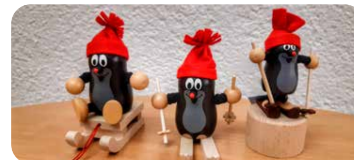
Regionale Produkte der Touristinformationen

Markt 1, 02763 Zittau, Tel.: 03583 7976 400 eMail: tourismuszentrum@zittauer-gebirge.com ; www.zittauer-gebirge.com Die aktuellen Öffnungszeiten des Tourismuszentrums Naturpark Zittauer Gebirge sind: Montag – Freitag 10.00 – 18.00 Uhr Samstag 10.00 – 13.00 Uhr