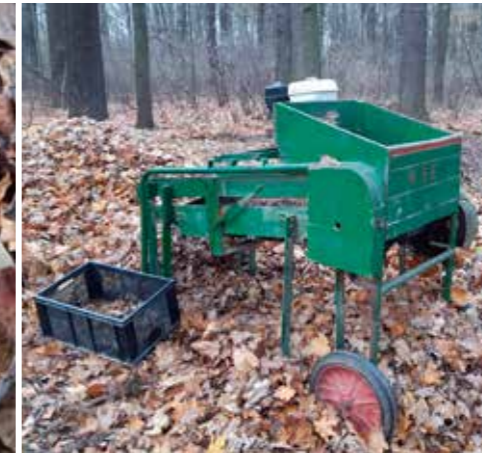
Rüttelmaschine zur Saatgutreinigung