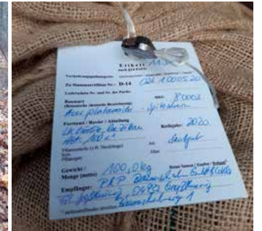
Spitzahornsamen mit Herkunftsnachweis

den es wissen: Harry Potter's Zauberstab bestand aus dem geschnitzten Ast einer Stechpalme; aber auch J.W. v. Goethes Spazierstöcke waren aus eben diesem Holz gefertigt. Heute werden vor allem in Großbritannien die Zweige der Stechpalme als Weihnachtsschmuck verwendet. In Deutschland ist diese Art streng geschützt. Sie gilt als eine Gewinnerin in der laufenden Klimaerwärmung. Es wird beobachtet, dass sie sich an den Grenzen ihres Verbreitungsgebietes weiter ausdehnt – so östlich der Odermündung in Polen oder im Norden Dänemarks.