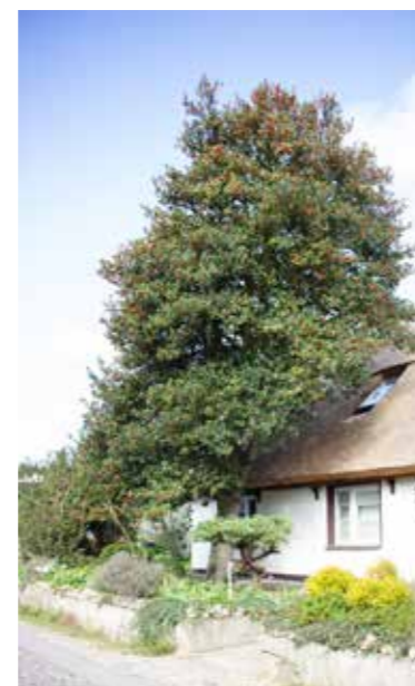
Große Stechpalme in Groß Zicker auf Rügen

Die Auswahl dieser Art wird bei Vielen zuerst ein Stirnrunzeln hervorrufen – ist sie doch ganz überwiegend nur als (Zier-) Strauch bekannt. Aber ja, die Stechpalme ist ein Baum, der immerhin 10 bis 15 m hoch werden kann. Ob Baum oder Strauch – das ist eine Frage der Lichtverhältnisse. Aber der Reihe nach: Das natürliche Verbreitungsgebiet der Stechpalme ist das atlantisch geprägte Europa ohne Früh- oder Spätfröste sowie das westliche bis zentrale Mittelmeergebiet. In Deutschland ist sie im